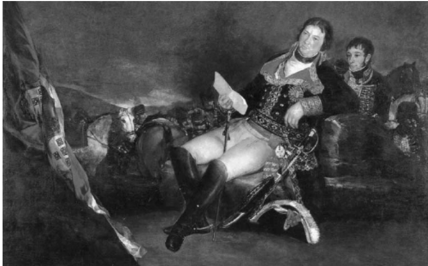
Retrato de Manuel Godoy, por Francisco de Goya